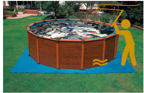
万博にて展示予定の古着の釣り堀体験イメージ

近年、世界中で約3000億着も廃棄処分される洋服のファッションロスは深刻な問題となっています。弊社はこれまで自社が運営するサステナブルアウトレットモール「SMASELL」にて排出量累計CO2削減量を可視化、また様々なアーティストやデザイナーとのアップサイクルプロジェクト（使われなくなったものを新たなデザインで再生）を実施して参りました。このような取り組みから、大阪・関西万博のテーマ『脱炭素』、大阪パビリオンのテーマ"REBORN"に強く共感し、出展参加に応募。過去累計2000トン以上ものCO2削減実績を評価いただき、出展企業に選ばれました。大阪・関西万博では、再流通によるCO2削減量を可視化するだけでなく、カーボンクレジット化し、お買い物に使えるポイントに還元する仕組みを展示することで、来場者の皆さまに楽しんで頂きます。