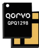
Qorvo QPQ1298 High-Performance BAW Filter