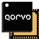
Qorvo QPA2310 C-Band 50W GaN Power Amplifier