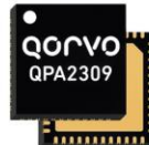
Qorvo QPA2309 C-Band 100W GaN Power Amplifier