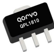
Qorvo QPL181x Suite of CATV Amplifiers