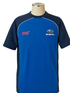
B賞: サンディスクのロゴ入り オリジナルGTチームTシャツ