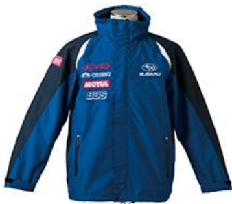
A賞: サンディスクのロゴ入り オリジナルGTチームジャケット