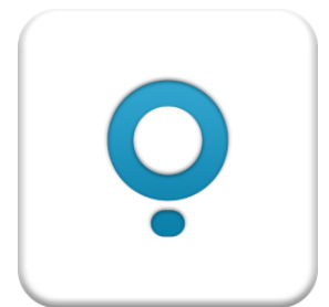
▲ 「スマポ」 アプリアイコン