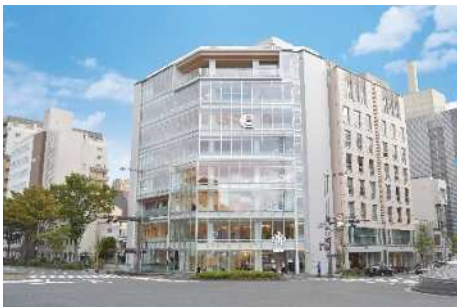
〈 QUESTION 〉