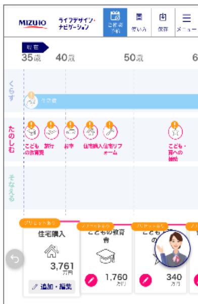
あらかじめ平均値を入力