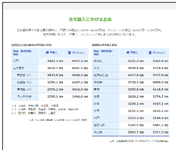
参考となる統計値の情報提供