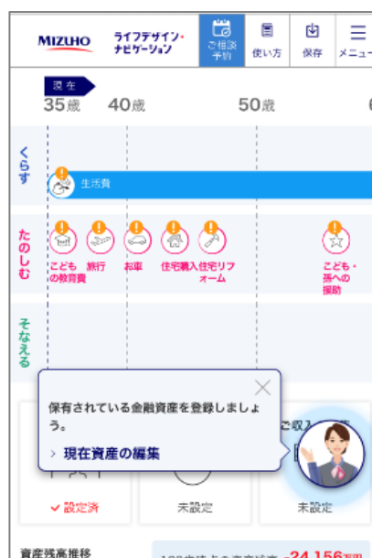
コンシェルジュのサポート