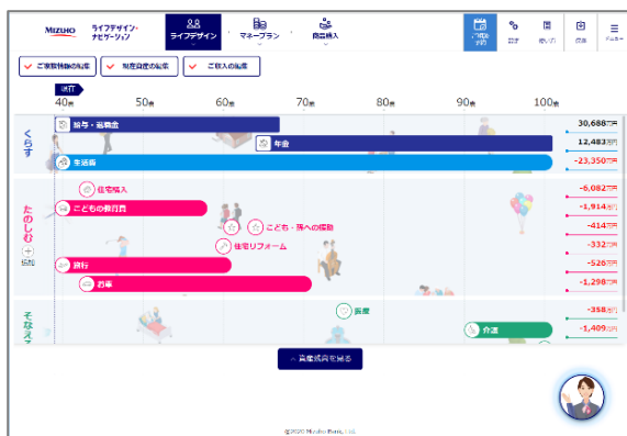
ライフデザイン年表

また、資産残高推移では、お金の面で自分のライフデザイン年表の人生を実現できるのかを確認し、必要な対策について具体的に考えることができます。