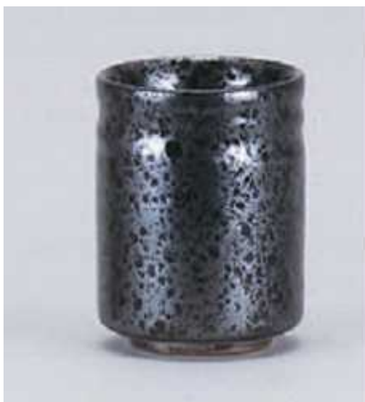
美濃焼きの湯呑み「油滴天目(ゆてきてんもく)」イメージ