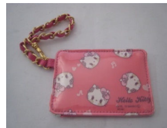
商品名：パスケース 価格：¥1,680- (1,600) カラー展開：イエロー／パープル／ピンク