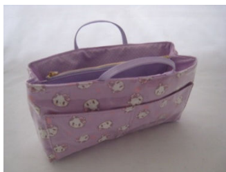
商品名：バッグインバッグ 価格：¥2,940- (2,800) カラー展開：イエロー／パープル／ピンク

横浜美術短期大学グラフィックデザインコース卒業。 同大学映像メディアデザイン研究室助手として勤務する傍ら、イラストレーターとしても活動。 au公式サービスであるEZクリエイターズカフェ所属クリエイターとして携帯コンテンツを配信し、女の子のメルヘンポップな世界観を描いたイラストが高い人気を誇る。