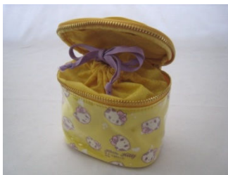
商品名：パニティポーチ 価格：¥2,625- (2,500) カラー展開：イエロー／パープル／ピンク