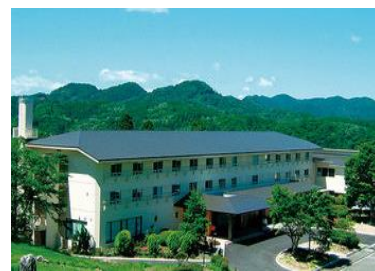
① 休暇村帝釈峡【さもやまの湯】