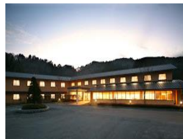
② ひば・道後山高原荘【すずらんの湯】