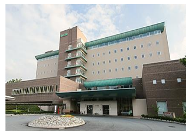
③ かんぼの郷 庄原【庄原さくら温泉】