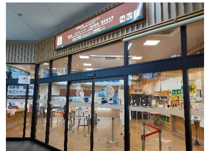
東武日光駅ツーリストセンター