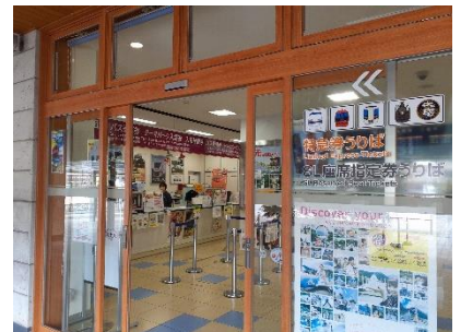
鬼怒川温泉駅ツーリストセンター