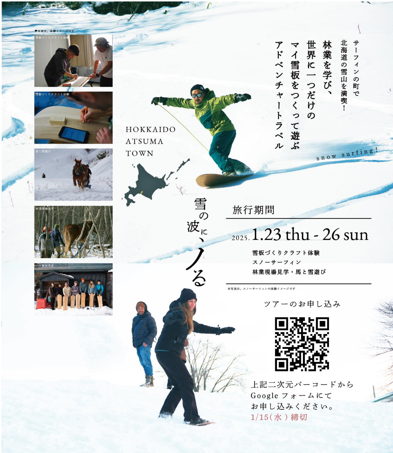
▼写真は、体験イメージです