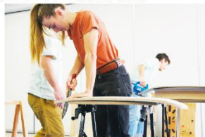
雪板づくりクラフト体験