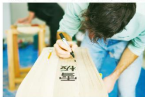
雪板づくりクラフト体験

・写真は、すべてイメージです「厚真町で実施した雪板モニターツアーの様子より（2023）」