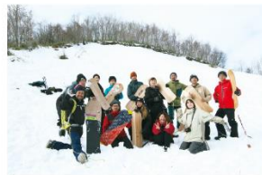
モニターツアー集合写真