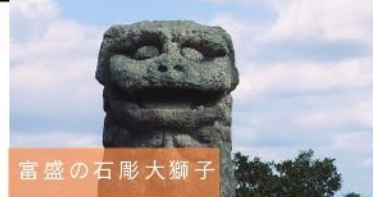
富盛の石彫大獅子

旅行条件<要約> 詳しい旅行条件を説明した書面をお渡しいたしますので、事前にご確認の上お申込みください。 本旅行条件書は、旅行業法第12条の4に定める取引条件説明書面及び同法第12条の5に定める契約書面の一部となります。この条件に定めのない事項は、当社旅行業約款（募集型企画旅行契約の部）によります。 当社旅行業約款は当社ホームページからご覧いただけます。