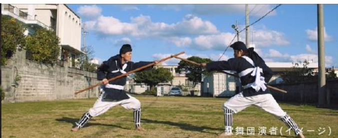
歌舞団演者(イメージ)