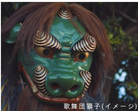
歌舞団獅子(イメージ)