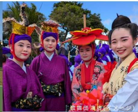
歌舞団演者(イメージ)