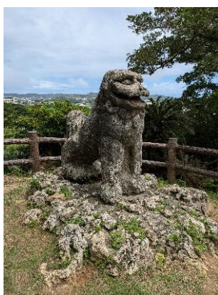
富盛の石彫大獅子

東武トップツアーズ株式会社（本社：東京都墨田区、代表取締役社長：百木田康二）は、沖縄県と公益財団法人沖縄県文化振興会と連携し、令和6年度文化資源を活用した沖縄観光の魅力アップ支援事業の一環として、『～八重瀬の祈り(UMUI)～ 暮らしと文化に寄り添う旅』を、2025年1月24日（金）～1月25日（土）の1泊2日と、1月26日（日）の日帰りを実施しますのでお知らせします。