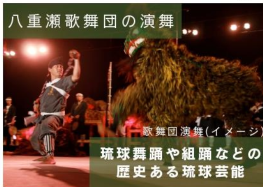
八重瀬歌舞団の演舞