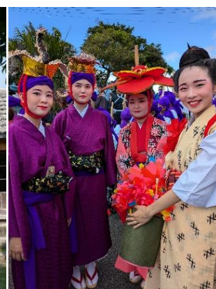
八重瀬歌舞団 演者

本ツアーは、地域で活躍する実演家、地域の文化資源（琉球舞踊、三線、エイサー等）を活用し、観光客の沖縄の芸能に対する認知度や理解度を高めることを目的とした文化体験等を盛り込み、沖縄観光の誘客促進を図るため実施するものです。