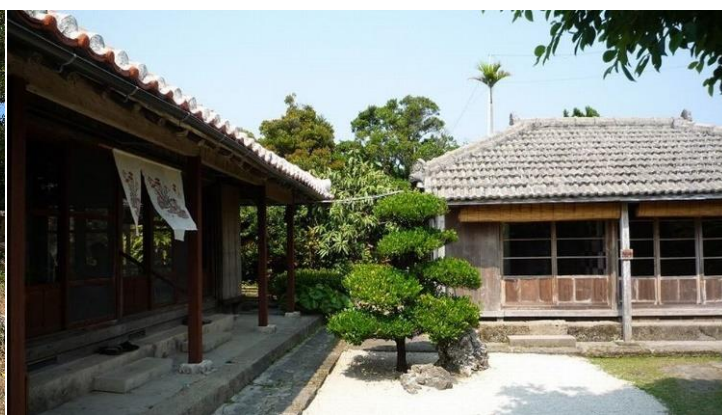
登録有形文化財 屋宜家