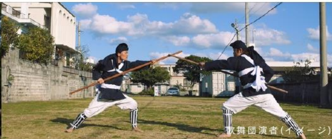
歌舞団演者(イメージ)