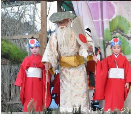
歌舞団演者(イメージ)