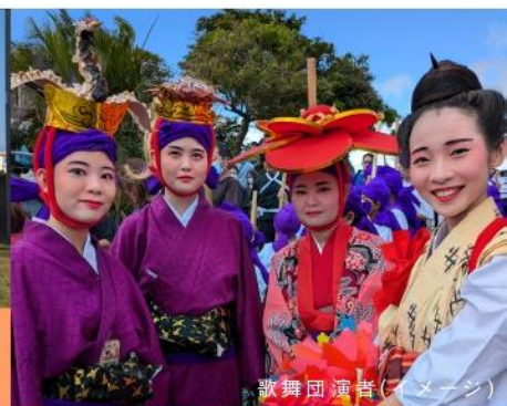
歌舞団演者(イメージ)