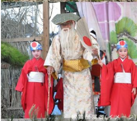
歌舞団演者(イメージ)