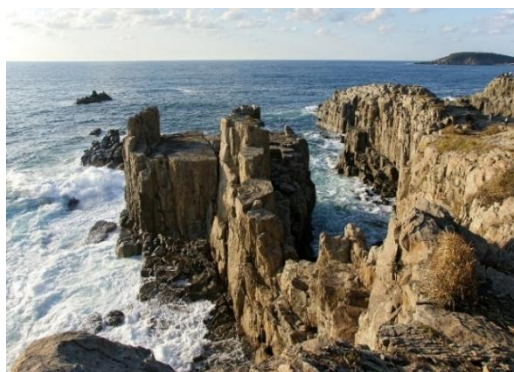
【東尋坊 三段岩・雄島】