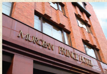
室蘭プリンスホテル