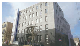
色内銀行街(旧三井物産)