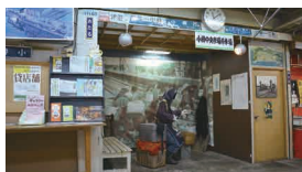
小樽中央市場(ガンガン部隊)