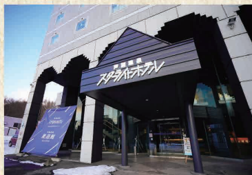
芦別温泉スターライトホテル