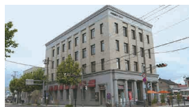
色内銀行街(旧三菱商事小樽支店)

には、旧国鉄手宮線で使用されていた鉄道施設を残しオープンスペースを整備し、オープンスペース以外の区間には当時の線路がそのまま残されている。