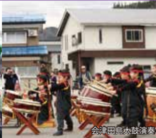
会津田島太鼓演奏