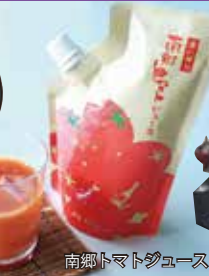
南郷マトジュース