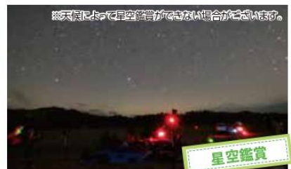
*天候によって星空観賞ができない場合がございます。