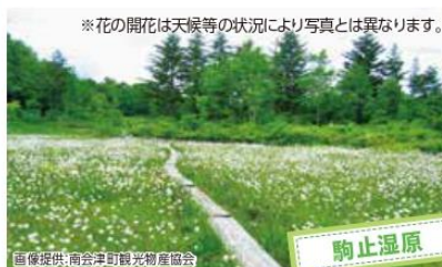
*花の開花は天候等の状況により写真とは異なります。