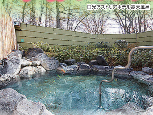
日光アストリアホテル露天風呂