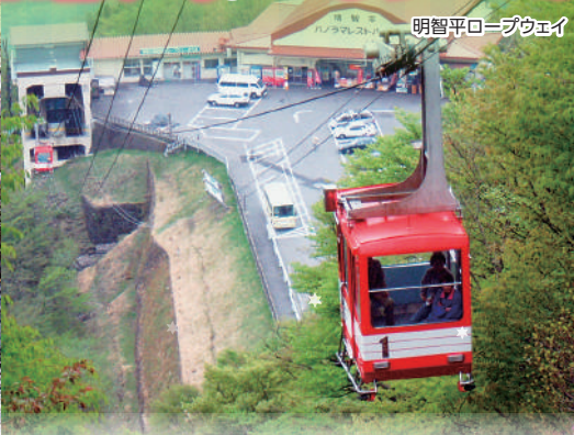
明智平ロープウェイ