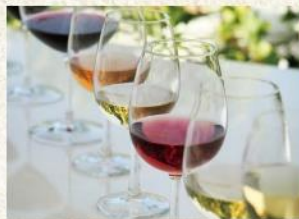
ココ・ファーム・ワイナリー