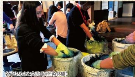
名草ふるさと交流館(藍染体験)