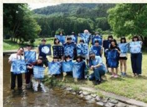
名草ふるさと交流館(藍染体験)