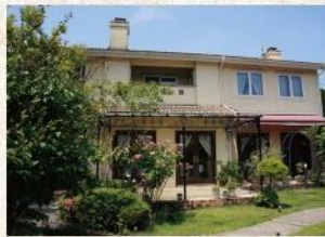
レストランヴィーヴル