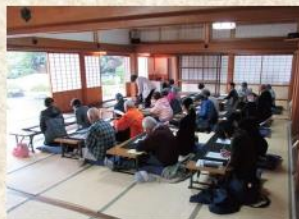
足利学校(書写体験)

※行程時間は気象条件・道路状況等により、多少前後する場合がございます。※各施設の写真はイメージです。