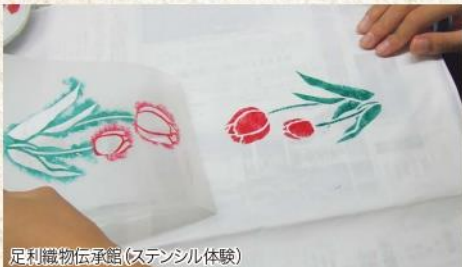
足利織物伝承館(ステンシル体験)