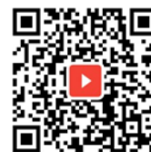
スマートコロナパス デモ画面動画

報道関係の方からのお問合せ 東武トップツアーズ株式会社 経営戦略部 広報担当 TEL:03-3622-6215