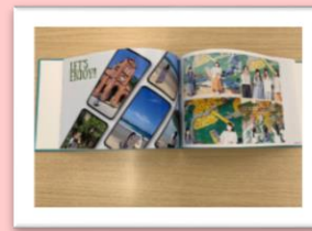
アルバム イメージ