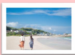
高崎海水浴 イメージ