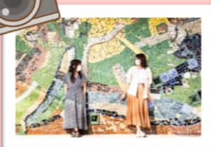
三井楽教会 イメージ