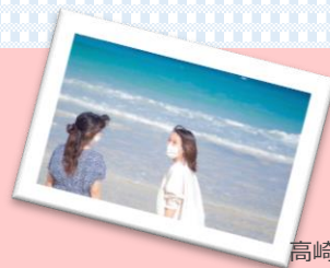
高崎海水浴 イメージ