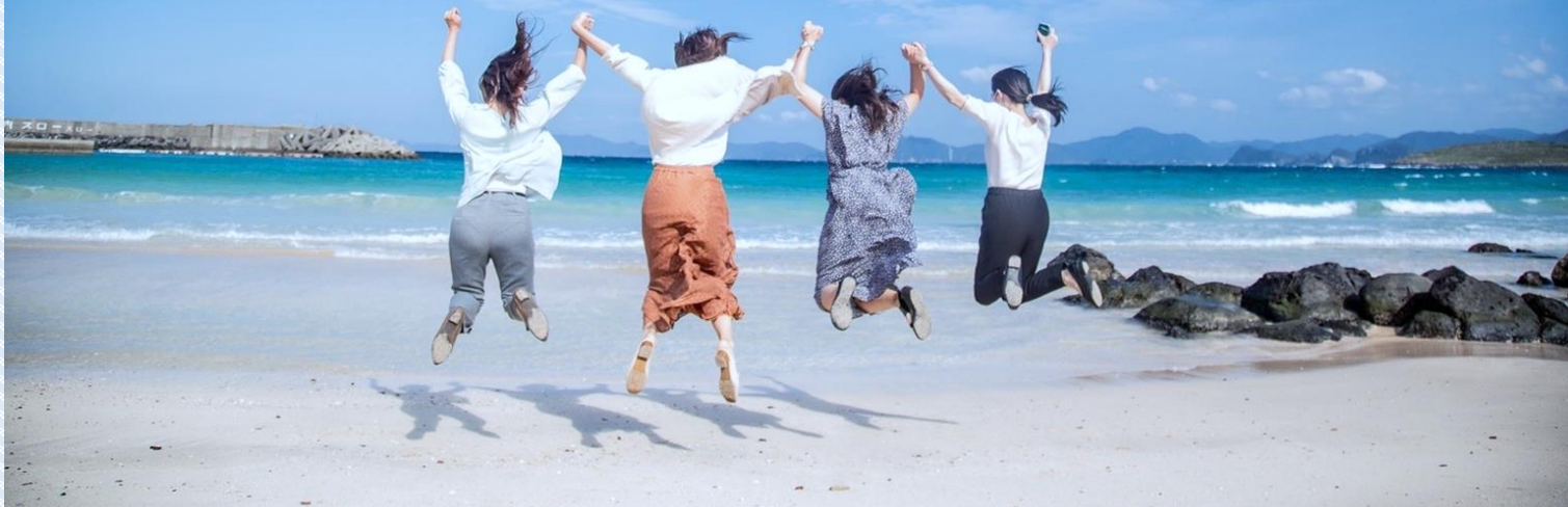
高崎海水浴場 イメージ