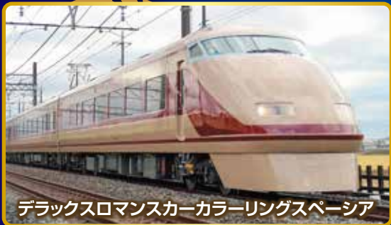
デラックスロマンسカーカラーリングスペース