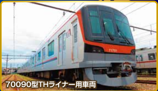
70090型THライナー用車両