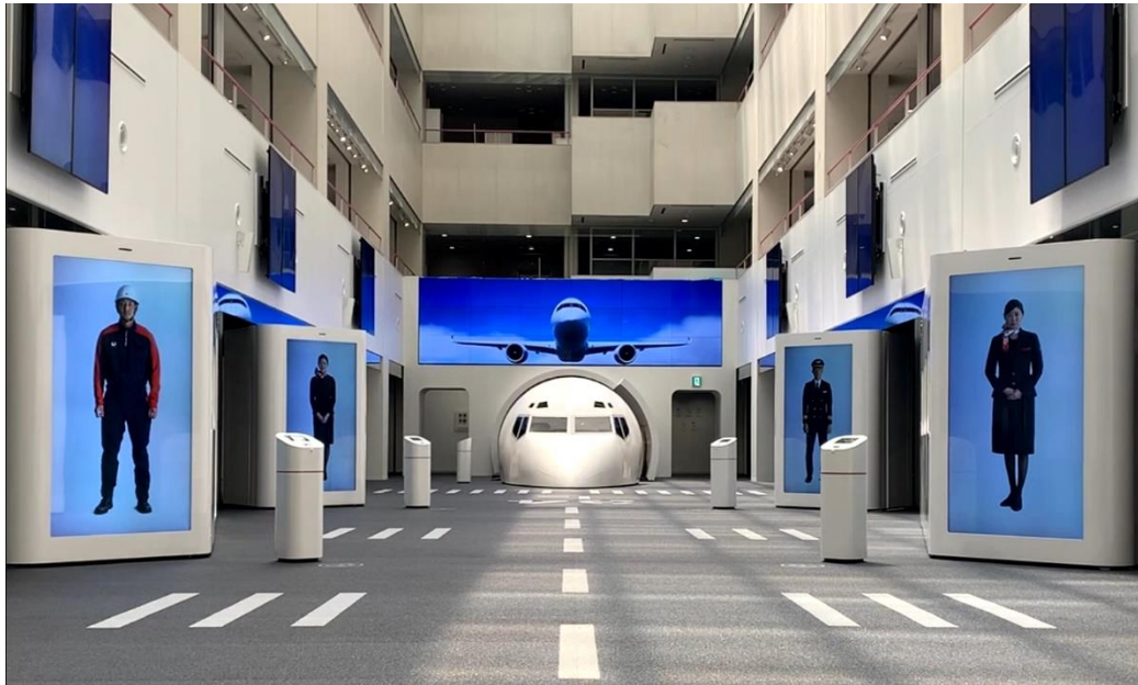
JAL SKY MUSEUM