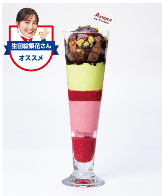
アデカのジミスゴパフェ