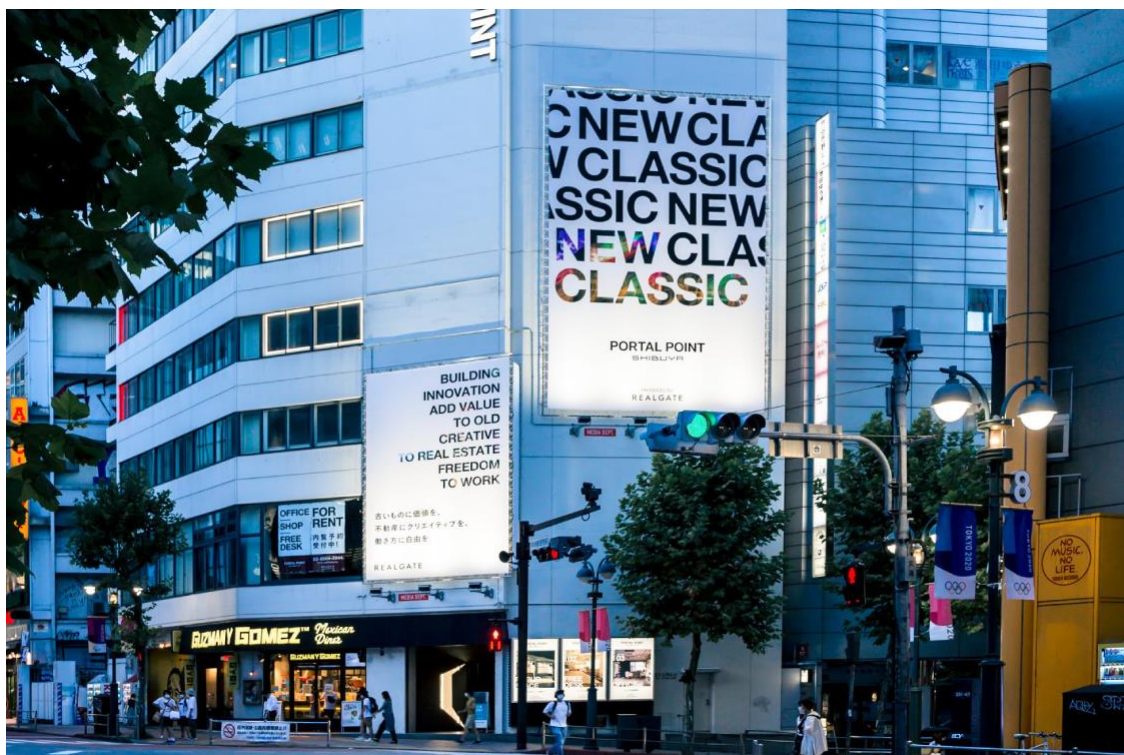
▲PORTAL POINT SHIBUYA 外観

■PORTAL POINT SHIBUYA 公式サイト： https://portalpoint.jp/shibuya/