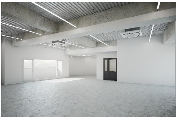
▲オフィス区画引渡し時イメージ