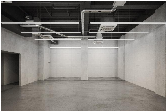
▲B1F ショップ区画引渡し時イメージ