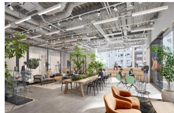
▲入居テナントイメージ※