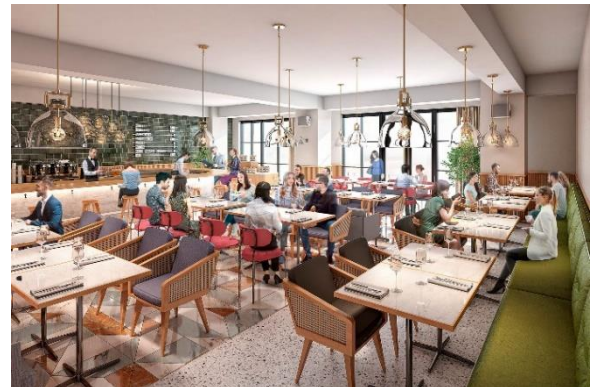
▲入居テナントイメージ※