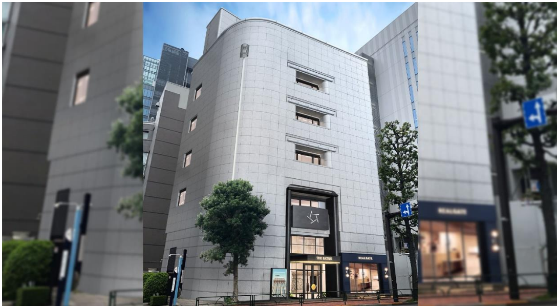
▲THE BATON - Minami Aoyama 外観イメージ