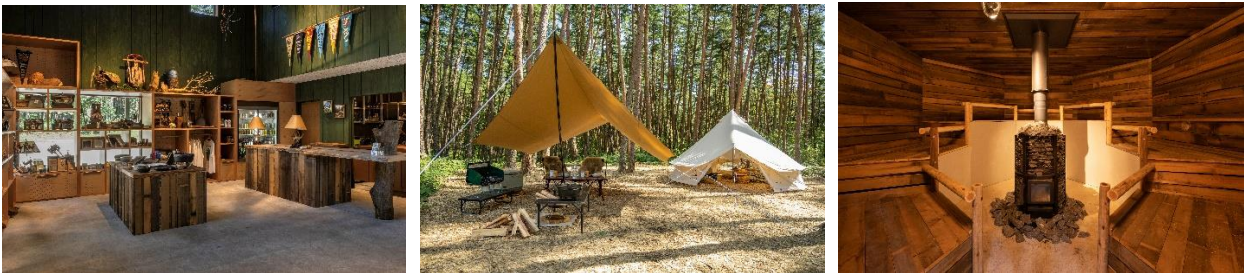
▲FOLKWOOD VILLAGE 八ヶ岳

「neu.Room」は、リアルゲイトが企画・デザインを行い、自社が運営管理を行うオフィスや複合施設に入居する約1,200社に向けた1日1組限定のワーケーション施設として提供していきます。