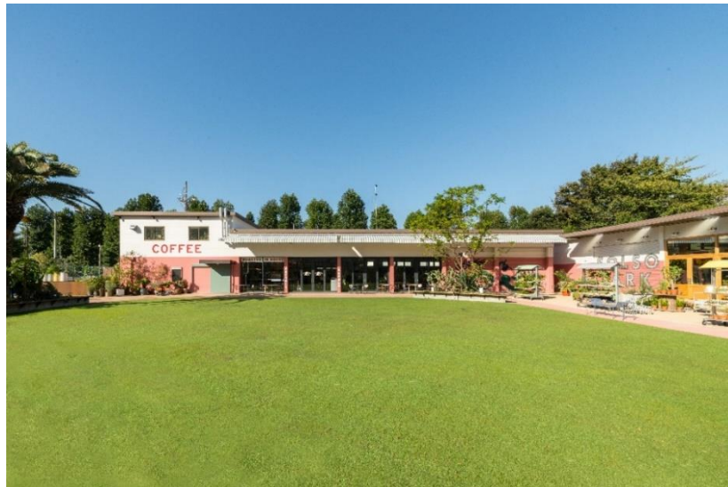
▲開放的な芝生広場「GRASS SQUARE」