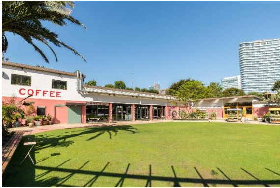
▲ZONE 2 「GRASS SQUARE」