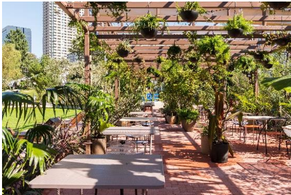
▲ZONE 3 「SYMBOLIC GARDEN」

タープの開閉により雨天時も利用可能な屋外スペース。マルシェや野外ワークショップなどに適したゾーンです。