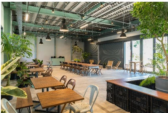
▲ZONE 1 「WAREHOUSE VENUE」

ロースターカフェに隣接した約 200 m 2 の室内イベントスペース。倉庫をリノベーションした天高約 4.8m の大空間は、展示会やポップアップショップ、トークショーなどにご利用可能です。