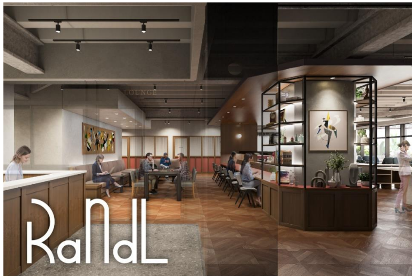
▲RandL TAKANAWA GATEWAY 5F ラウンジイメージ