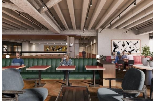
▲1F ラウンジ/5F ラウンジイメージ