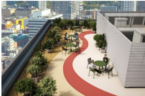
▲5F テラス/ルーフトップテラスイメージ