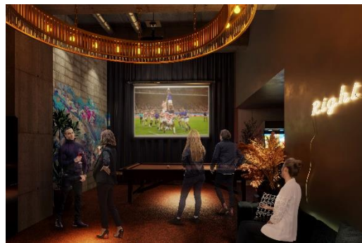
▲B1 プレイラウンジイメージ