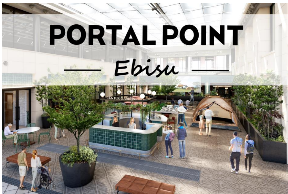
▲コミュニティラウンジイメージ（イベント開催時）

スタートアップ向けクリエイティブオフィスを都内で48棟手掛ける株式会社リアルゲイト（本社：東京都港区、代表取締役：岩本 裕、以下「リアルゲイト」）は、恵比寿ガーデンプレイス内ガラススクエア地下1階の約460坪のスペースに、複合施設「PORTAL POINT -Ebisu-（ポータルポイント恵比寿）」を今秋オープンします。