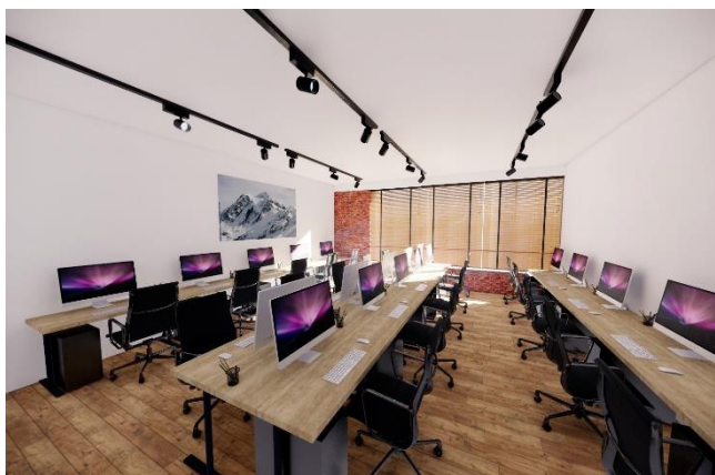
▲プライベートオフィスイメージ