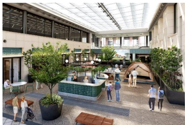
▲コミュニティラウンジイメージ（イベント利用時）

施設の中心に位置する約 320 m 2 のコミュニティラウンジは、8.6mもの開放的な吹き抜けのガラス張り天井で、リラックスしながら仕事や打合せができる空間。一角では展示会やワークショップ、ヨガなどのイベント利用も可能で、入居者のみならず周辺ワーカーや地域住民との「交流」の場所として利用できる。