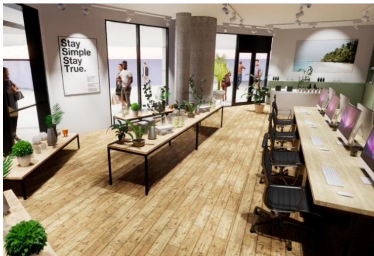
▲ショールームオフィスのレイアウトイメージ

ガラスの壁で囲まれた空間で、企業独自の雰囲気を作り上げることができ、店舗兼事務所として利用可能。