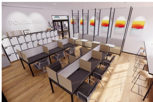
▲フリーデスクスペースイメージ