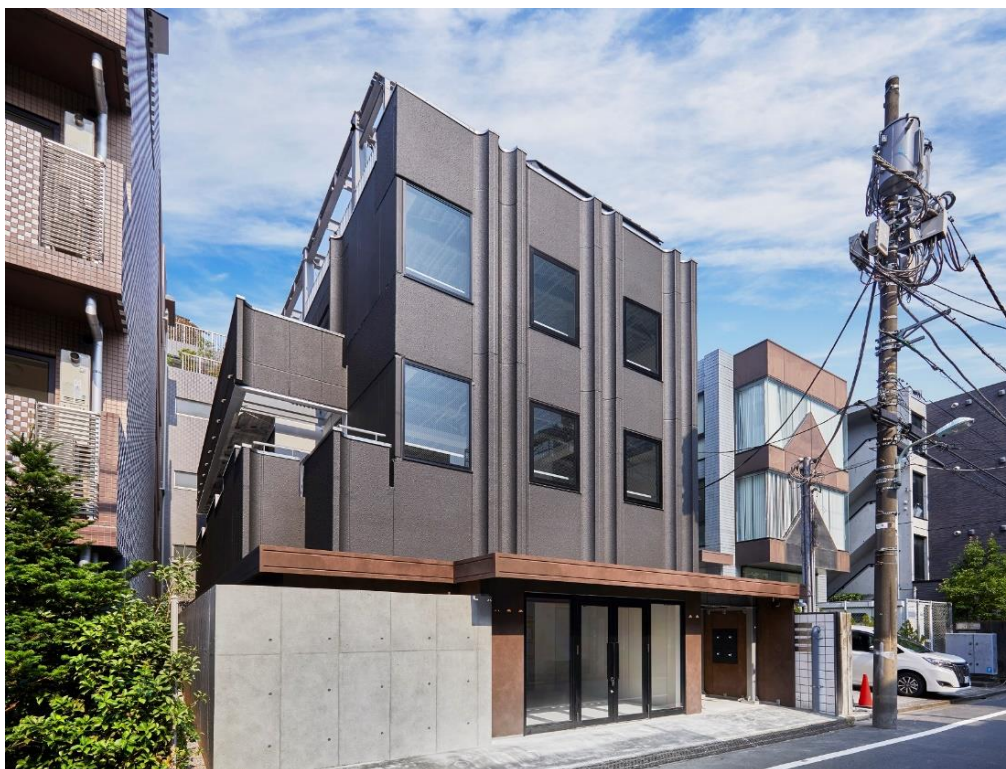
▲東急建設へ売却した OMB 北参道の外観