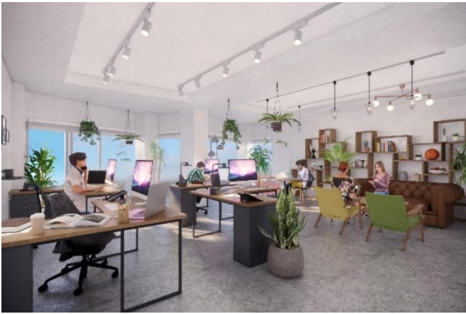
▲オフィス専有部レイアウトイメージ（※家具付帯なし）