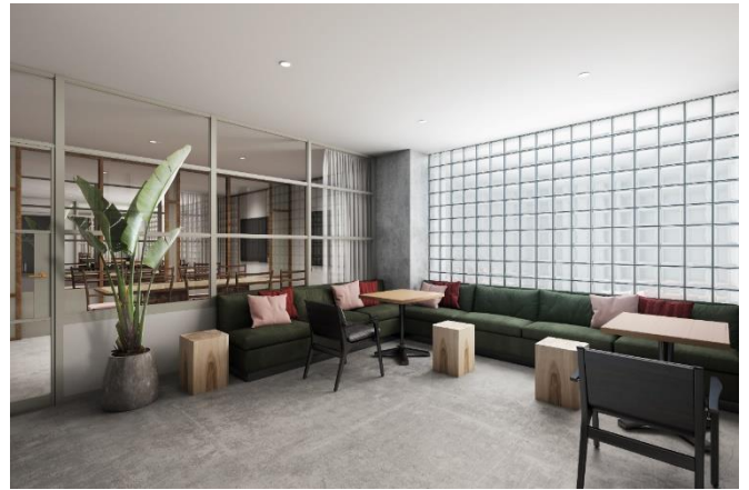
▲ロビーラウンジ、会議室イメージ

共用部には、洗練されたインテリアデザインのロビーラウンジ及び、入居者専用のワークラウンジを設けることで人の密集を回避。またリモート会議やテレワークニーズに応える、8名用会議室と1人用個室型WEBミーティングブースをご用意しました。集中して作業できる場所を専有部以外にも設けることで、ワーカーの生産性向上を実現しつつ、ニューノーマルな「働き方」に順応したワークスペースを提供します。