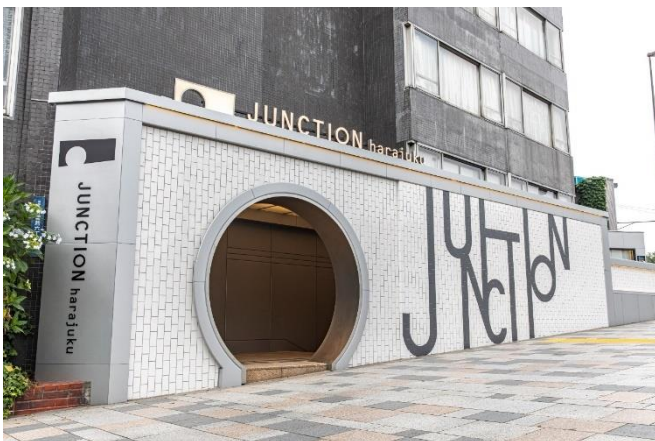
▲JUNCTION harajuku 外観

共用部には、洗練されたインテリアデザインのロビーラウンジ及び、入居者専用のワークラウンジを設けることで人の密集を回避。またリモート会議やテレワークニーズに応える、8名用会議室と1人用個室型WEBミーティングブースをご用意しました。集中して作業できる場所を専有部以外にも設けることで、ワーカーの生産性向上を実現しつつ、ニューノーマルな「働き方」に順応したワークスペースを提供します。