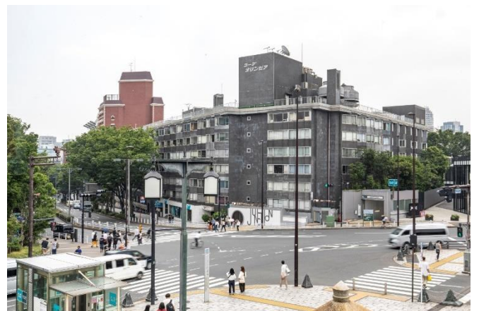
▲原宿駅側から当施設を臨む