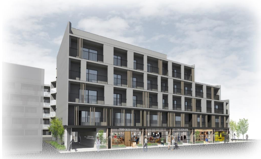
▲東側（店舗・オフィス）外観イメージ

本計画は、東急東横線「中目黒」駅徒歩7分の目黒区青葉台1丁目に、地上5階建、約1,560坪の複合施設を新築するもので、2021年1月末に竣工、2月オープン予定です。周辺は飲食店、アパレルが軒を連ねるエリアでありながら、閑静な住宅が立ち並び、利便性の高さで住環境に優れています。その立地特性を活かし、レジデンス、スモールオフィス、ショップからなる複合施設を計画しました。