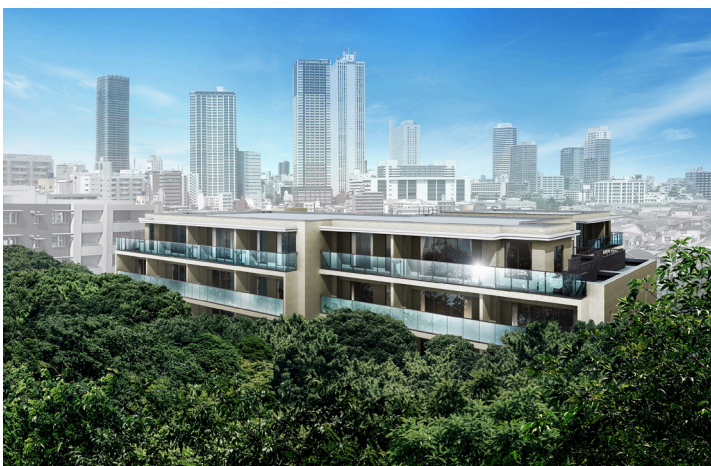
「ブランズ文京護国寺」外観

第一弾の計画である、平成27年3月上旬販売開始予定の「ブランズ文京護国寺」、および同年4月下旬販売開始予定の「(仮称)ブランズ市川レフィール」と、今後もコラボレーション物件を展開予定。1人でも多くの方に花や緑と暮らす時間を提供していきます。