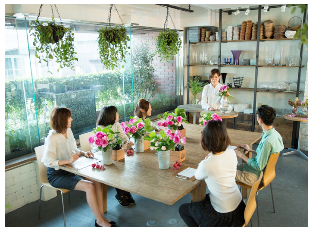
(イメージ) 入居者への講習会