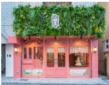
小楽園 TEA SALON & BOUTIQUE