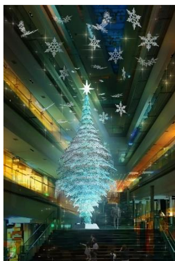
吹抜け大階段(イメージ)