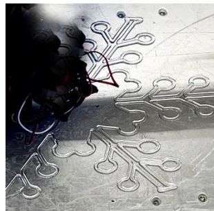
3D プリンターでの出力風景