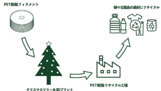
ケミカルリサイクルイメージ図