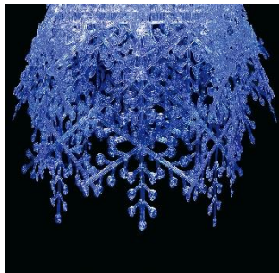
クリスマスツリー(イメージ)

※2：廃プラスチックを分子レベルに分解して様々な製品の原料として再利用する方法（下図参照）