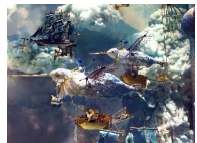
Anniversaire summer window