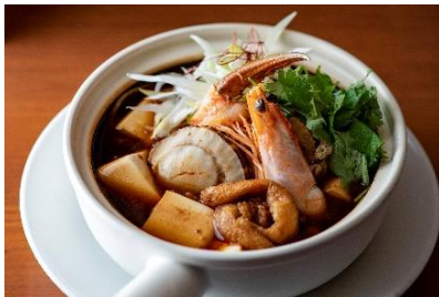
【シビレヌードルズ 蠟燭屋】本館 3F 海鮮3種の麻婆土鍋 (2,500 円/税込)

お店の人気メニューの中から、大トロ、中トロ、白身、づけまぐろ、光物2種、カニ身、車海老、貝、ウニ、いくら、穴子一本、トロタケ巻と、超贅沢良いトコロ取りのセットをご用意。ボリューム満点で日本らしい極上感、満足感をお楽しみください。※1 日限定 5 食