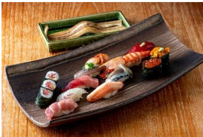
【築地玉寿司 ささしぐれ】本館 3F 贅沢ご褒美にぎり (7,000 円/税込)

甘めのポートワインソースでソテーしたフォアグラが贅沢に2枚も入った極上バーガー。フレッシュなりんごのスライスとルッコラで爽やかな食感と香りを加え、濃厚でありながらさっぱりとした食後感のバーガーになっています。※1 日限定 5 食