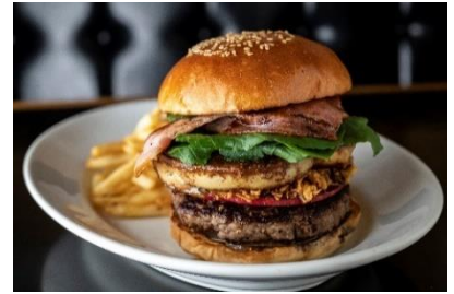
【ゴールデンブラウン】本館 3F フォアグラ&アップルバーガー (2,530 円/税込)

蒸して旨味を閉じ込めた毛蟹を丁寧にほぐし、加熱で甘みが増すシシリアンルージュと共に贅沢にソースに。一本一本手で延ばして作る、コシのある力強い食感のピチと合わせ、フレッシュな数種類のハーブをアクセントに仕上げています。※1 日限定 5 食