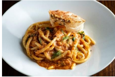
【フラテリパラディソ】本館 3F 毛蟹とシシリアンルージュのトマトソース 自家製手打ちパスタ「ピチ」 (3,500 円/税込)

蒸して旨味を閉じ込めた毛蟹を丁寧にほぐし、加熱で甘みが増すシシリアンルージュと共に贅沢にソースに。一本一本手で延ばして作る、コシのある力強い食感のピチと合わせ、フレッシュな数種類のハーブをアクセントに仕上げています。※1 日限定 5 食