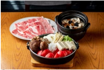
【やさい家めい】本館 3F 鳥取和牛ときのこ、トマトのすき焼きとトリュフ土鍋ご飯 (8,789 円/税込)

鳥取和牛をトマトやきのこ、厳選野菜とあわせていただくすき焼きは年末年始にふさわしい一品で、からだの中からヘルシーに温まります。自慢のお野菜を楽しめる前菜5種もセットになったコースのべには、トリュフ香る土鍋ご飯をご提供。