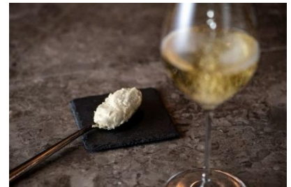
【ワインショップ・エノテカ&バー】本館 3F