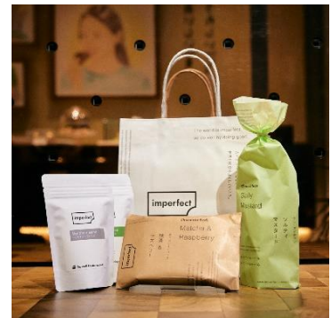
インパーフェクト (同潤館 1F) 1,000円 (1,340円相当) 各日限定10個 2,000円 (2,860円相当) 各日限定10個 ※2,000円の福袋の中身イメージです。

※福袋には、ワイン1本が入っています。 ※5,000円の福袋の中身イメージです。