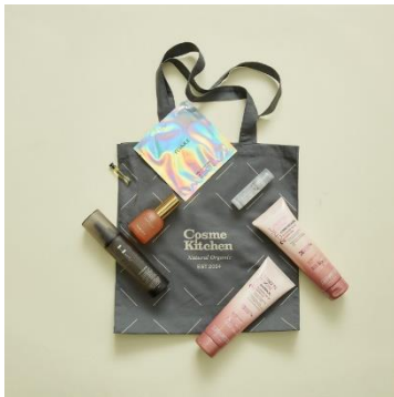
コスメキッチン ビューティー (本館 B2F) 7,700円 (15,570円相当) 限定20個