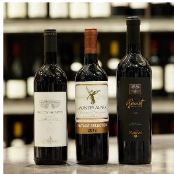
ワインショップ・エノテカ&バー (本館 3F) 5,000円 (5,500～46,200円相当) 10,000円 (11,000～99,000円相当) 各限定50個

※福袋には、ワイン1本が入っています。 ※5,000円の福袋の中身イメージです。