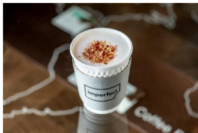
【インパーフェクト】同潤館 1F ホワイトストロベリーチョコレート (750 円/税込)

ルイ・ロデレールが造る上品な味わいのシャンパーニュに、モンドールチーズを合わせた季節を感じるペアリングセット。寒い季節に造られるこのチーズは、とろりと滑らかなミルクのコクに針葉樹の香りが重なり、穏やかな味わいを楽しめます。※閉店 30 分前 L. 0. ※1 日限定 10 食