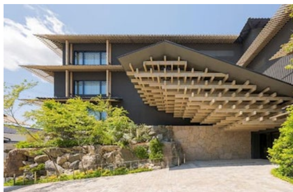
バンヤンツリー・東山 京都