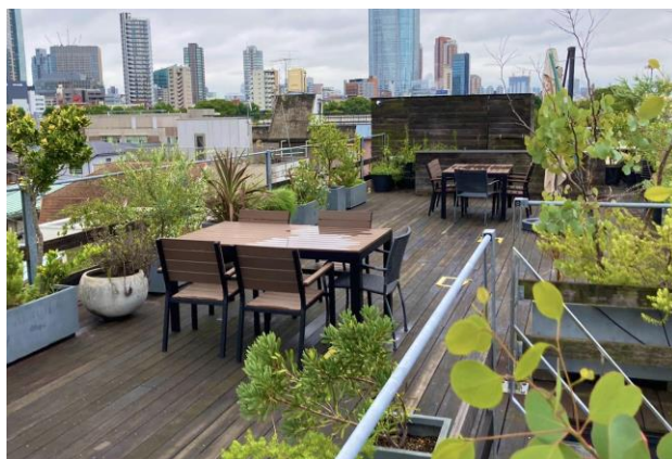
屋上のリフレッシュスペース