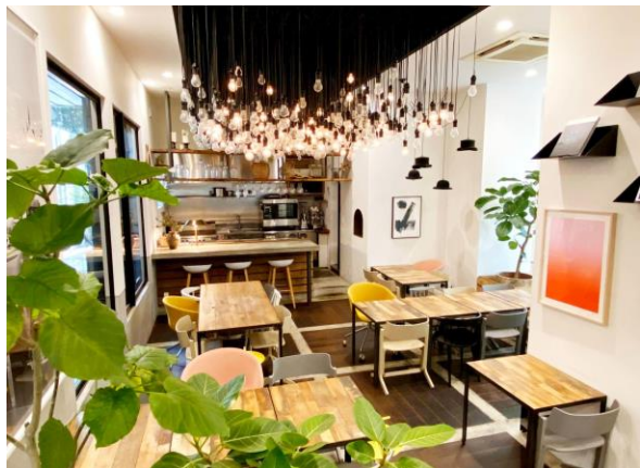
開放的でランチもOKなラウンジ