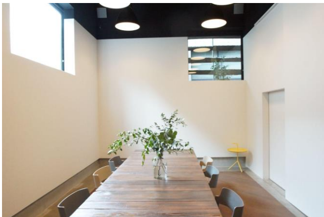
天井高でゆとりのある会議室