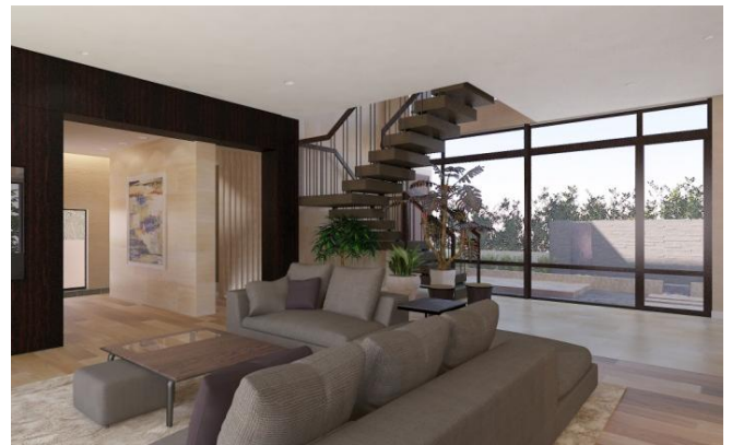
3mの天井高と5mの大開口を実現したリビング