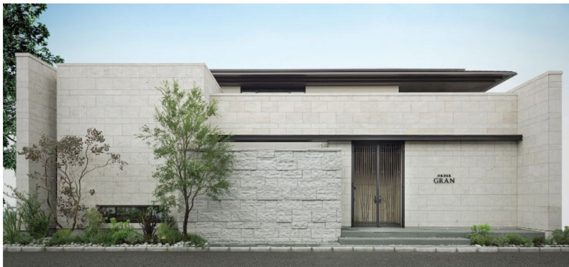
『ORDER GRAN』駒沢ステージ2 ホームギャラリー 外観

三菱地所ホームは今後も、高い顧客ニーズに高品質・高付加価値な提案でお応えする住まいづくりに努めてまいります。