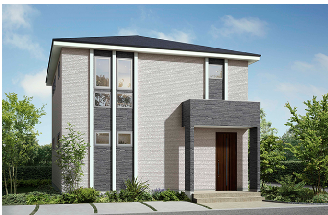
2階建てタイプ（オーセンティックデザイン）

『SMART ORDER Fit』はキャンペーン商品と同様に価格の決まった建物外形フレームから敷地形状に合わせて最適なフレームを選び、間取り作成キットや新しく開発したデジタルツールを使って担当者と共に理想の住まいを創りあげていきます。住宅設備仕様を思いのままにレイアウトしながら、外観デザインやインテリアなども自分好みに上げることが可能です。販売価格は1,490万（24.04坪）～と三菱地所ホームの建物品質はそのままに、コンパクト&リーズナブルにお客様の想いをカタチにできる商品となっています。