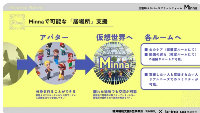
Minnaで可能な「居場所」支援