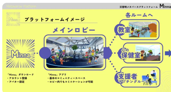
【Minna】プラットフォームイメージ

メタバース内では「アバター」という分身を作ることができる為、まず、着替えができない、お風呂に入れないなどQOLが低下している避難生活でも参加しやすいことが利点となります。