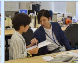
家族の隣で、一緒にお仕事。