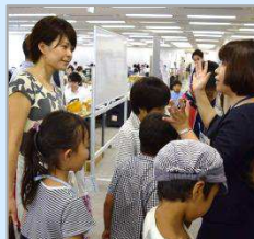
社内見学のようす。 配偶者の方も興味津々。