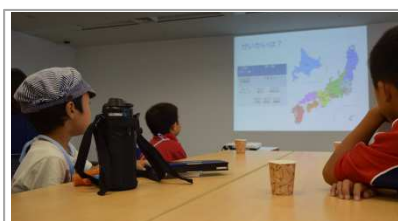
会社の紹介を熱心に聞いています。