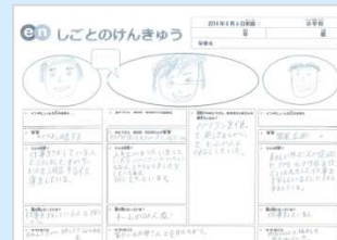
「しごと研究」の発表内容

※単なる会社見学だけではなく、参加する子どもたちにとって「しごと」「社会」を学ぶ場になっています。