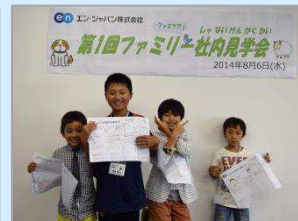
最後は元気に記念撮影。

エン・ジャパンは、これからも入社後の活躍・定着支援サービスを提供する企業として、自社社員の活躍・定着支援にもこだわってまいります。