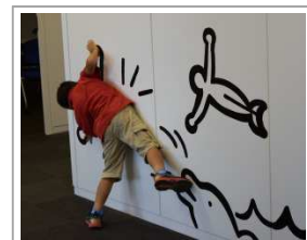
オフィスにはイラストがたくさん。 思わず一緒に。