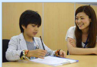
「しごと研究」で家族の仕事仲間に インタビューを実施。