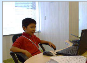
オフィスの広い机にビックリ。