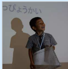
緊張しながらも、「しごと研究」を皆の前で発表。