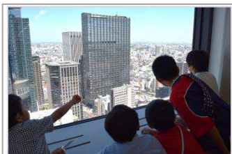
オフィスから見える 高層ビルの景色にビックリ。

日時 : 2014年8月6日（水）9:00～18:00 会場 : エン・ジャパン 本社（ http://corp.en-japan.com/profile/outline.html ） 対象 : エン・ジャパン社員の家族（配偶者、子ども） 参加者 : 7家族 12名