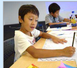
自宅の周りの仕事を 書き出してみよう。