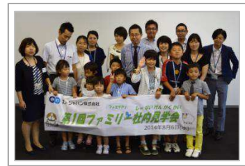
参加家族での記念撮影

成長とともに社員の年齢も上がり、家庭を持つ社員が増えてきたことを受け、当社初の社員の家族を対象とした会社見学・仕事理解イベントを開催いたしました。