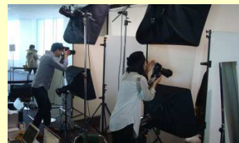
※写真は第一弾の撮影風景

プロカメラマンが、履歴書写真をコーディネート。姿勢や表情などアドバイスを交えながら、理想に近い写真を撮影し、その場でプレゼントします。