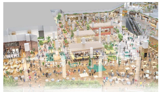
1F 南西側フードコート (イメージ)