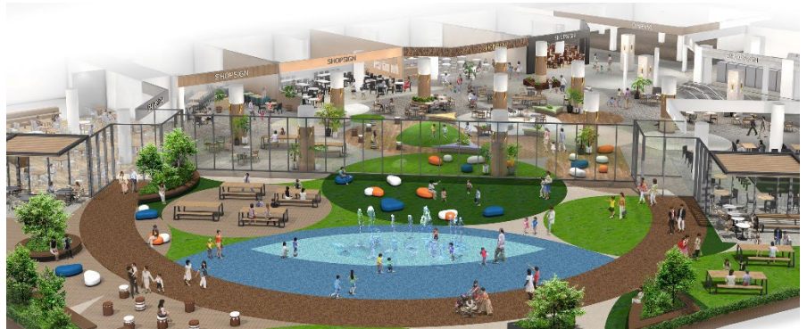
4F 屋上広場（イメージ）