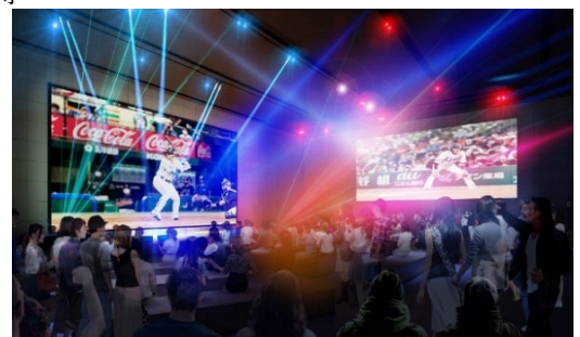
2F 広場空間 (イメージ)