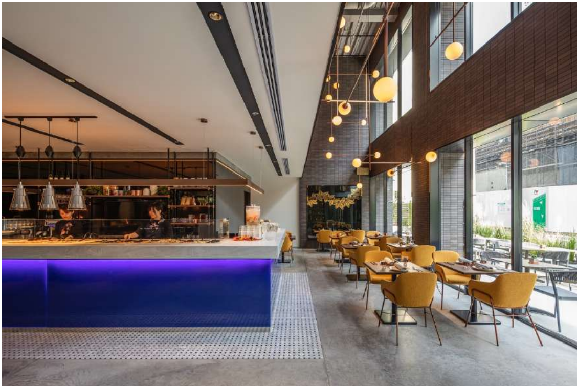
画像：1階 THE LIVELY KITCHEN

（ https://travelersnavi.com/coupon/osakawari ）をご確認下さい。※