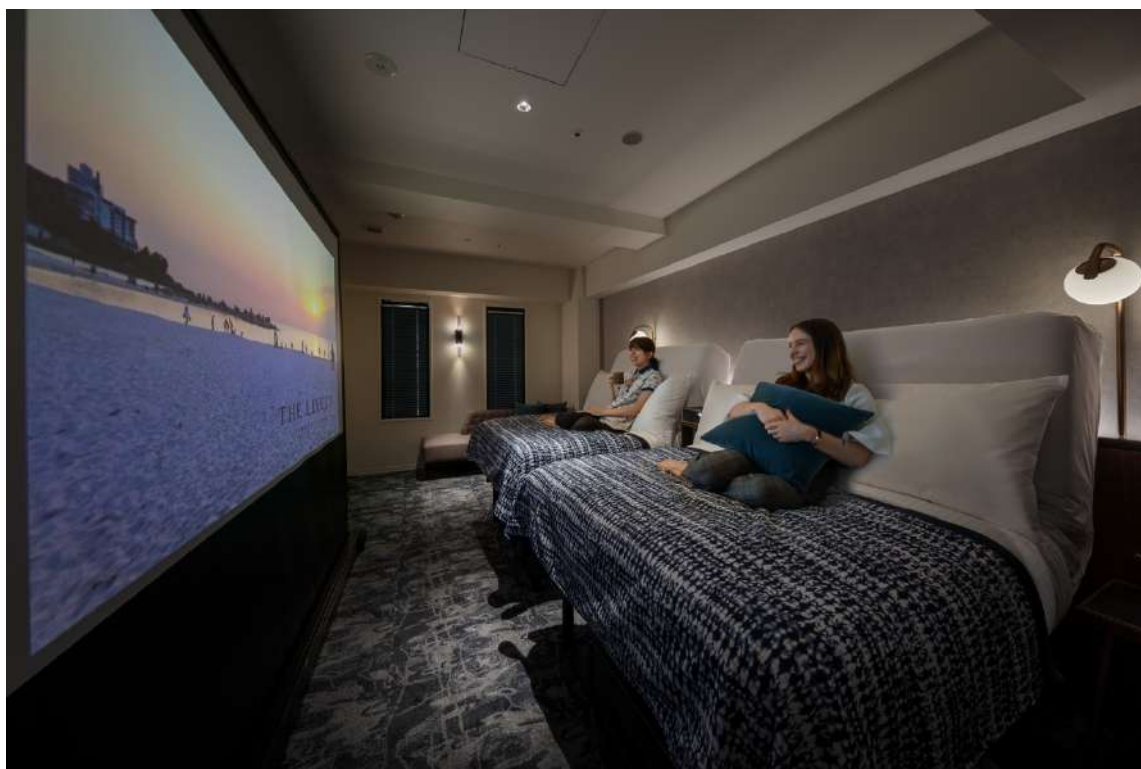
画像：客室（シアターツイン）