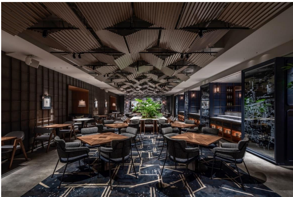
(画像：朝食会場 THE LIVLEY KITCHEN)