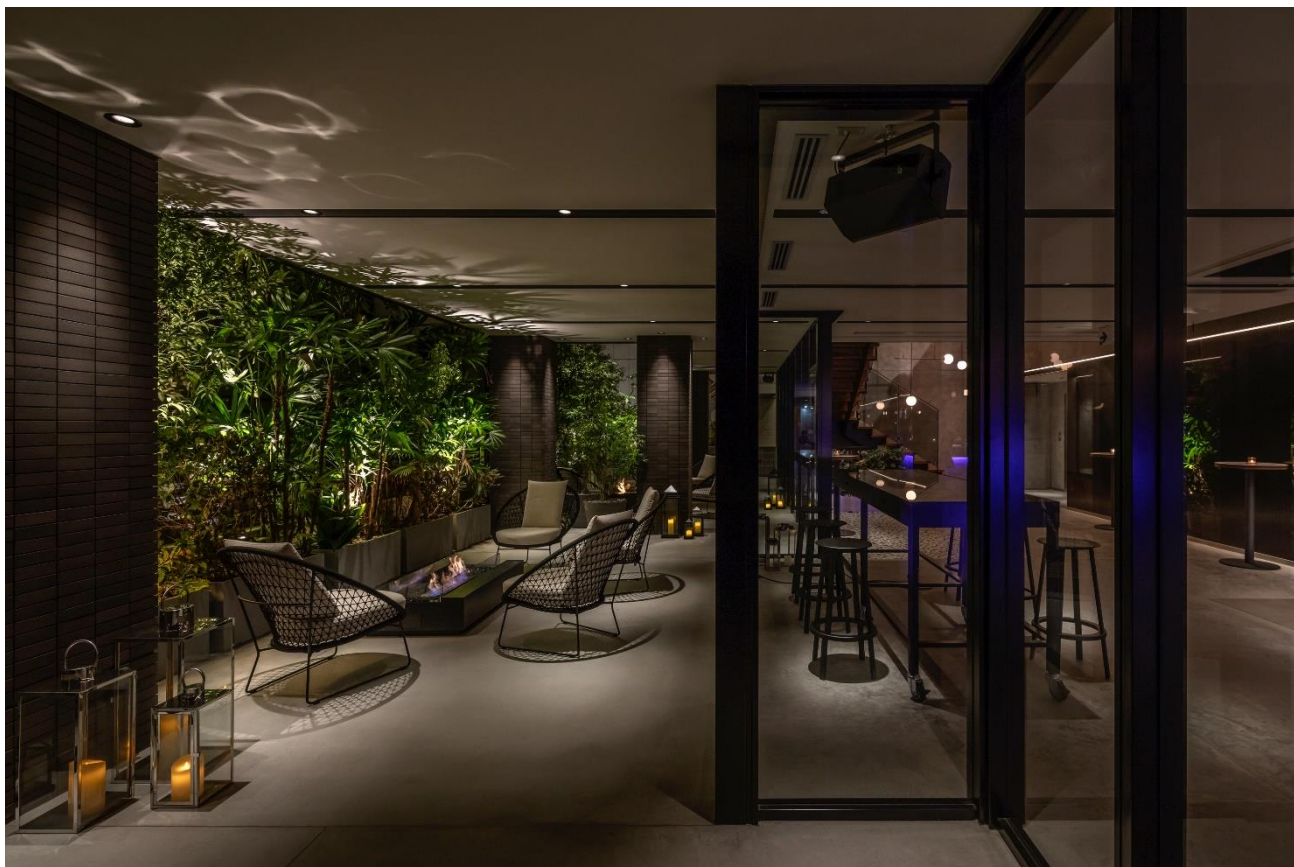
(画像：THE LIVELY 大阪本町ロビーラウンジ・テラス)