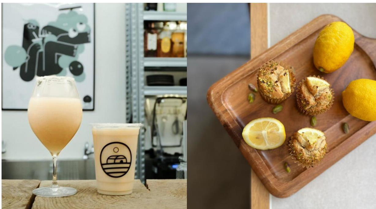
(画像左：左からソルティドッグ、ソルティスムージー、画像右：グルテンフリーマフィン ピスタチオレモン味)

今年の夏は、新鮮な旬のフルーツやからだにやさしいグルテンフリースイーツを味わいながら THE LIVELY 大阪本町ならではの“自分をアップデートする”体験をお楽しみください。