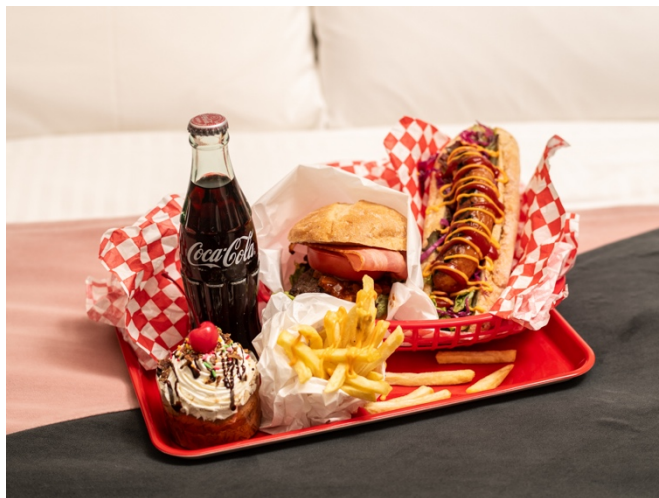
(画像はセット内容例)