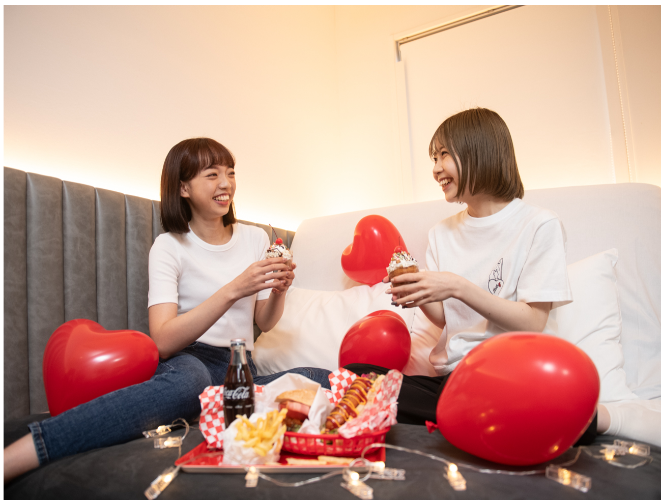
(画像：ルームサービス利用例。バルーンなど装飾品も好評販売中！)