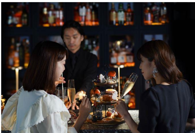
(画像：THE LIVELY BAR)