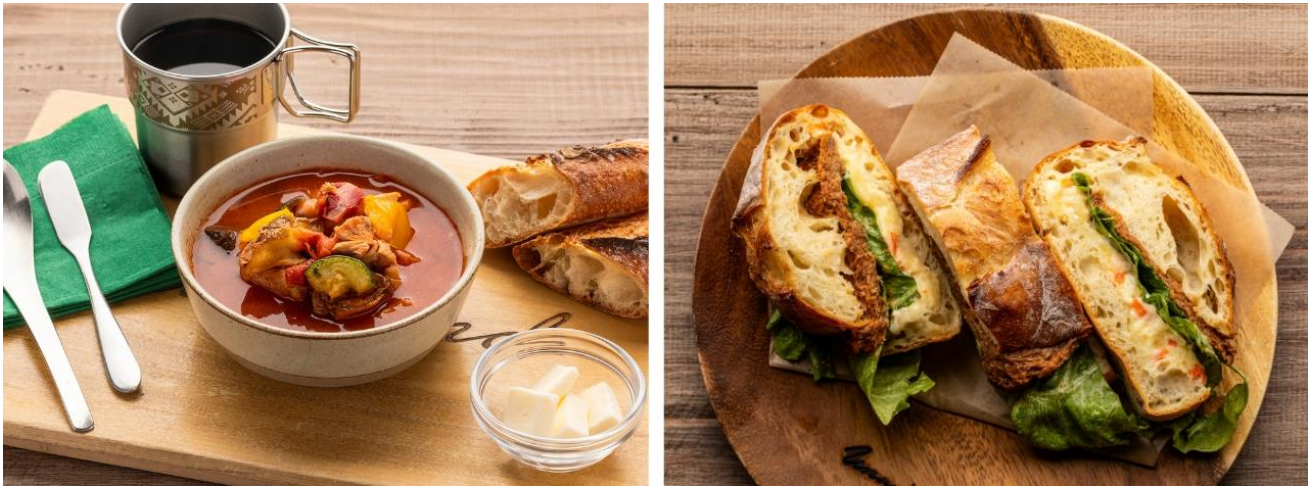
画像左から、UNWIND HOTEL & BAR 札幌 日替わりスープ、ブルドポークサンドイッチ